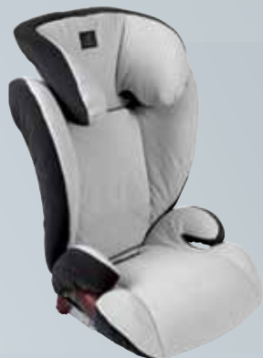
Детское сиденье KidFix

Это качество является чрезвычайно важным для каждого Вашего пассажира. Особенно для детей.