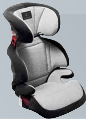
Детское сиденье KID

Детское сиденье с регулируемой по высоте спинкой для стандартных ремней безопасности обеспечивает оптимальную защиту от боковых ударов. Сиденье KidFix может быть закреплено на месте при помощи точек крепления ISOFIX или 3-точечного ремня безопасности. Возможна установка дополнительной системы автоматического распознавания детского сиденья. Для детей возрастом от 3,5 до 12 лет (от 15 до 36 кг).