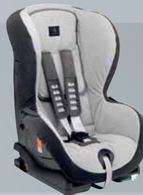
Детское сиденье DUO plus

Все детские сиденья также могут использоваться на автомобилях без точек крепления ISOFIX.