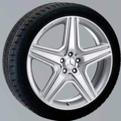
AMG 5-спицевый диск | Стил ь III