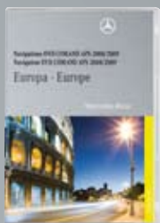
Навигационный DVD-диск по Европе для COMAND APS