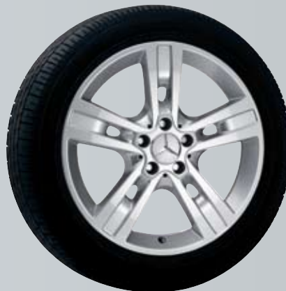
Gyas | 5-спицевый диск

Мы готовы предложить Вам новые возможности для выражения характера Вашего автомобиля, например, колесные диски дизайна incenio .