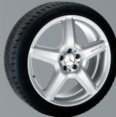
AMG 5-спицевый диск | Стил ь III

Диски: 10 J x 20 ET 46 | Шины: 295/40 R20