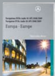
Навигационный DVD-диск по Европе для Audio 50 APS

Данные для навигационных систем «Мерседес-Бенц» регулярно обновляются. Для получения последней версии, пожалуйста, обращайтесь к официальным дилерам «Мерседес-Бенц»