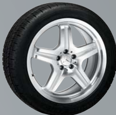
AMG 5-спицевый диск | Стил ь VI

Диски: 9 J x 21 ET 48 | Шины: 265/40 R21