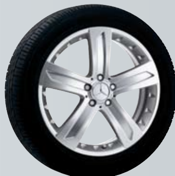
Klemola | 5-спицевый диск

B6 647 4212; несовместим с цепями противоскольжения