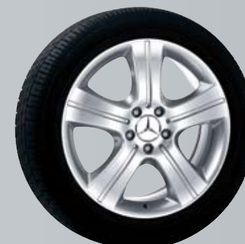
Mintaka | 5-спицевый диск

B6 647 4368; несовместим с цепями противоскольжения