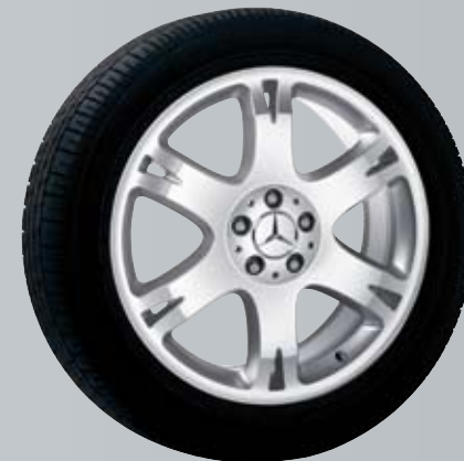
Rukbat | 6-спицевый диск