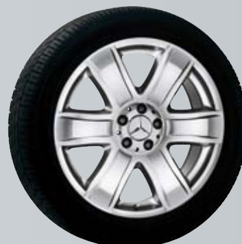
Alrai | 6-спицевый диск